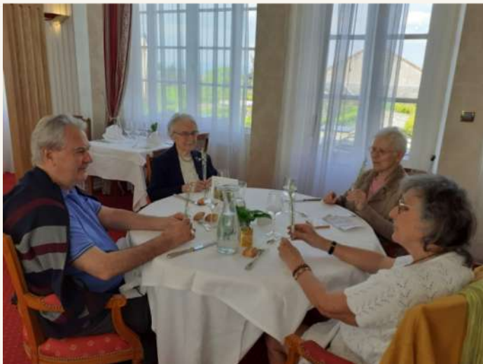
La Résidence Services Villa Médicis Autun