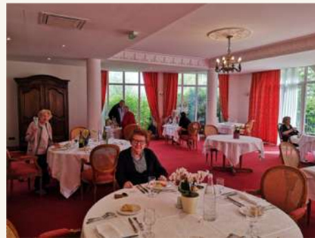
La Résidence Services Villa Médicis de Puteaux